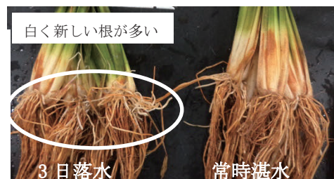
写真1 3日落水区の根の様子 (6月10日)

問い合わせ先：水田農業研究所水稻部 TEL:0235-64-2100 e-mail:ysuiden@pref.yamagata.jp